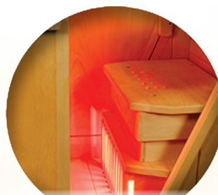
Daleka podczerwień hipertermia