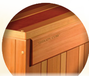
Naturalne lite drewno